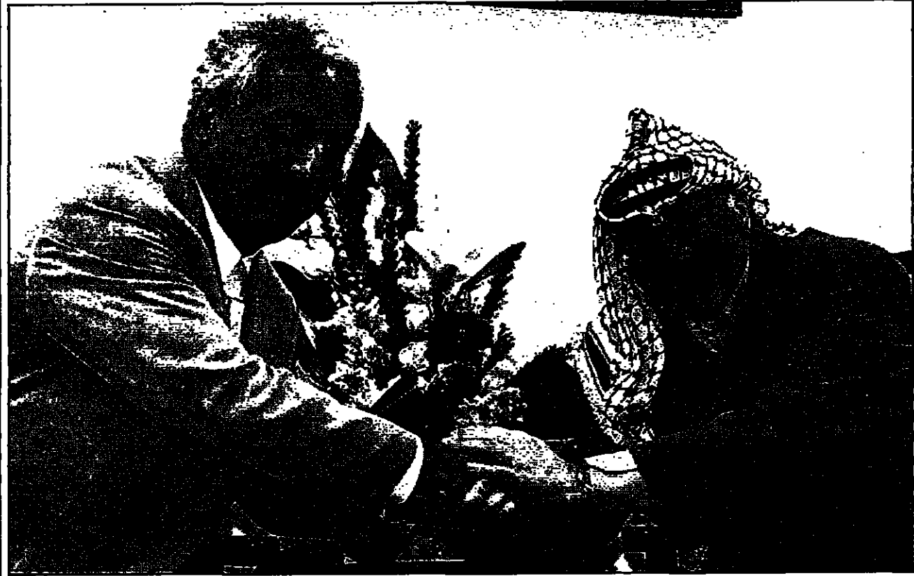
الرئيس عرفات يصافح رئيس وزراء رومانيا في رام الله

الطريفي وعبدالجواد صالح خارج التشكيلة الجديدة